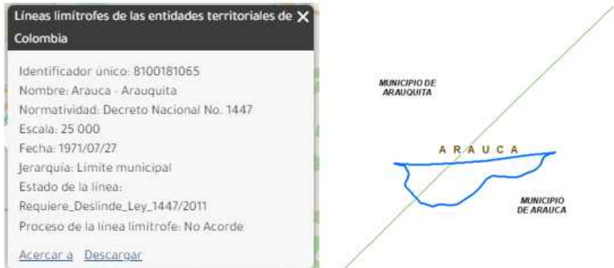
Figura 2. Información del estado de Línea Limitrofe entre las entidades territoriales Arauquita y Arauca Fuente : https://www.colombiaenmapas.gov.co/?e= 87.3432432910149,7.174220585663974,61.15183704102185,17.028144725569735,4686&b=igac&u=0&t=29&servicio=610 de fecha 31 mayo 2023.

“Por medio de la cual se determina la ubicación del Área del Yacimiento del Campo Macana - Formación Carbonera Inferior - Contrato de Asociación 997 de 2003 Área Chipirón”