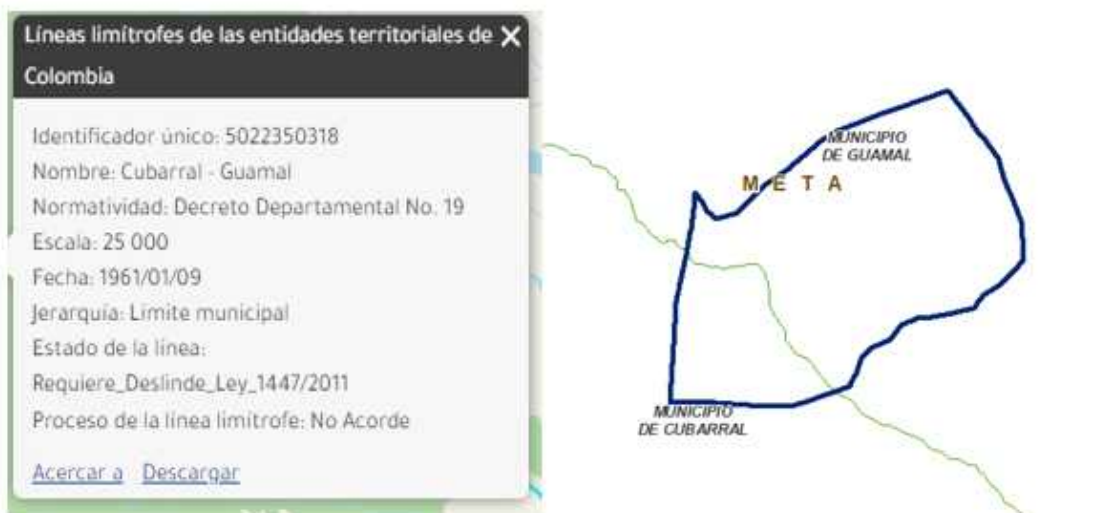
Figura 2. Información del estado de Línea Límitrofe entre las entidades territoriales Cubarral y Guamal, Fuente : https://www.colombiaenmapas.gov.co/?e=-82.06431262695507,-3.0968063784409345,-63.827007939459925,12.811634811771054,4686&b=igac&u=0&t=29&servicio=200 , de fecha 31/05/2023

“Por medio de la cual se deroga la Resolución 980 del 22 de agosto de 2022 y se determina la ubicación del Área del Yacimiento del Campo Lorito – Formación San Fernando – Contrato de Exploración y Producción CPO 9.”