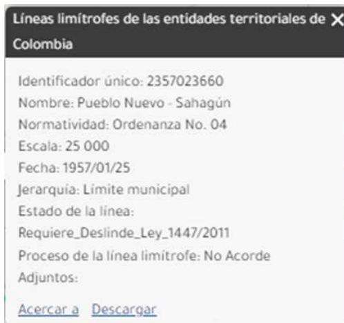
Figura 2. Información del estado de Línea Limítrofe entre las entidades territoriales de Pueblo Nuevo y Sahagún Fuente: https://www.colombiaenmapas.gov.co/?e=-86.88181750976501,-4.499911085433596,-61.61326282227172,14.306824340256185,4686&b=igac&u=0&t=29&servicio=200

La información limítrofe para las entidades territoriales de Pueblo Nuevo y Sahagún en el departamento de Córdoba es la siguiente: