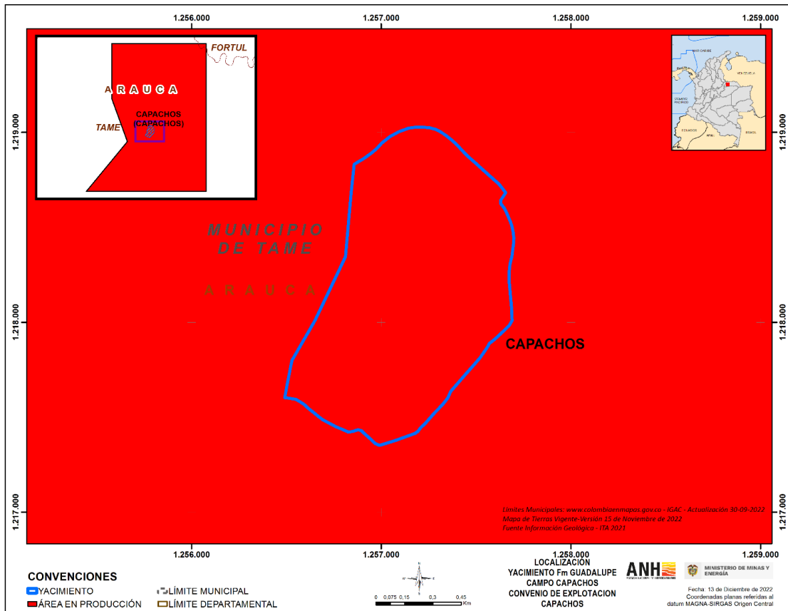
Figura 2. Localización Yacimiento Guadalupe Formación Guadalupe – Campo Capachos

Que el Área del Yacimiento de la Formación Guadalupe del Campo Capachos, proyectada en superficie, según la división político-administrativa establecida por el Instituto Geográfico Agustín Codazzi (IGAC), dispuesta, a través del link https://www.colombiamapas.gov.co/?e=-82.06431262695507,-3.0968063784409345,-63.827007939459925,12.811634811771054,4686&b=igac&u=0&t=29&servicio=200 , con fecha de actualización IGAC 30-09-2022, se ubica en su totalidad en el municipio de Tame, departamento de Arauca, como lo muestra la figura 2: